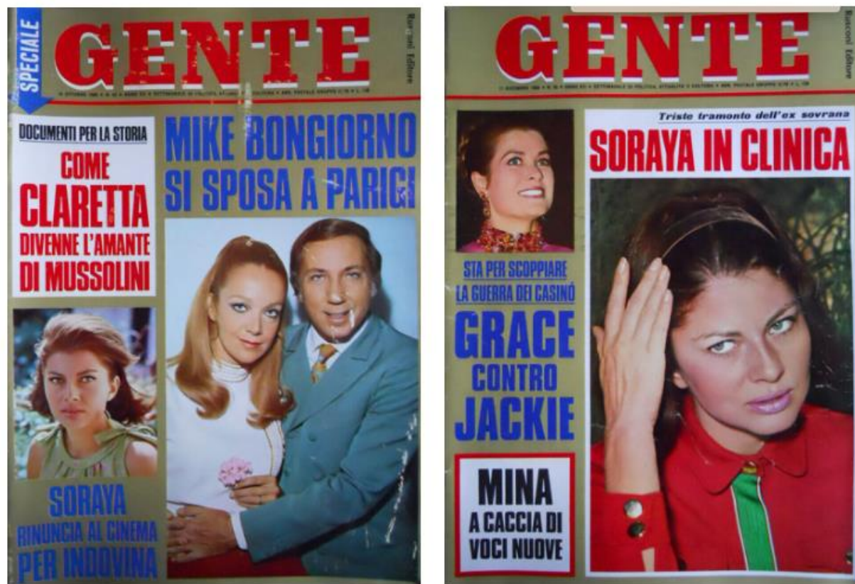
Figura 12-1: Copertine di «Gente», anno 1968