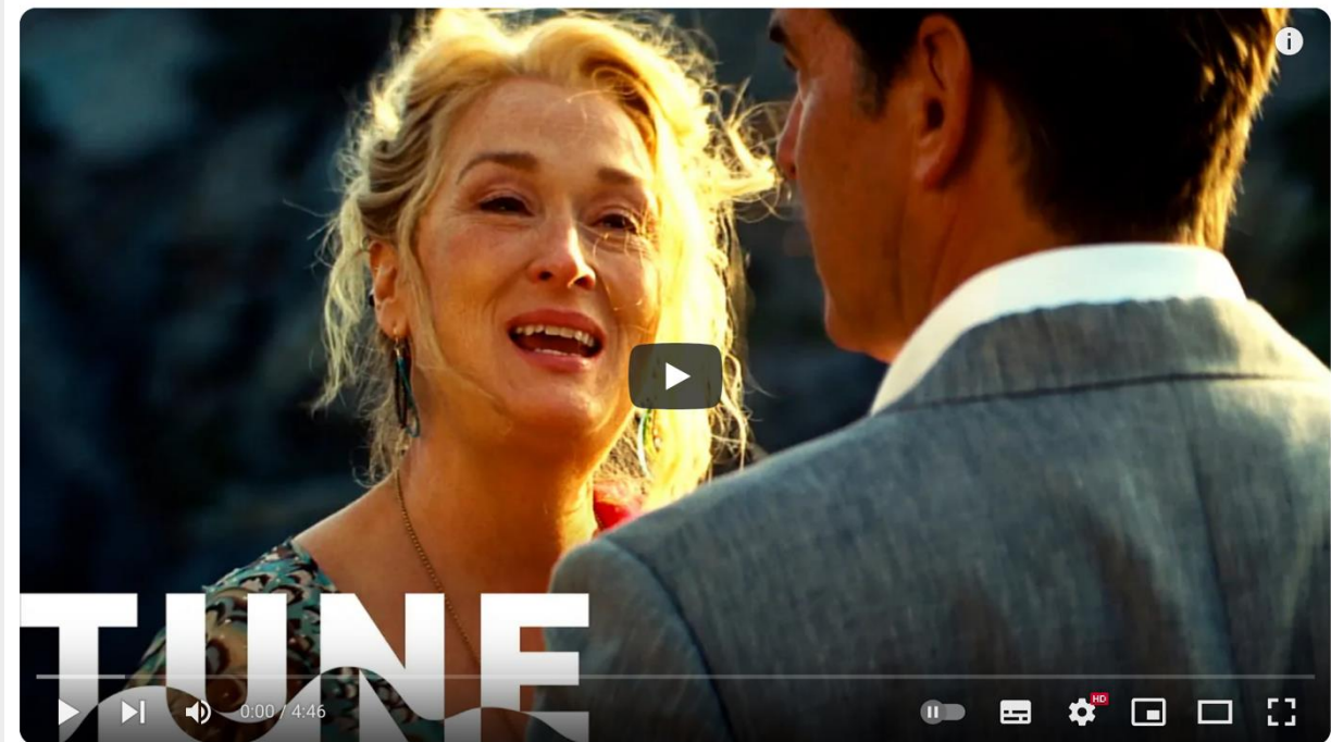
The Winner Takes It All (Meryl Streep) | Mamma Mia! (2008) | TUNE